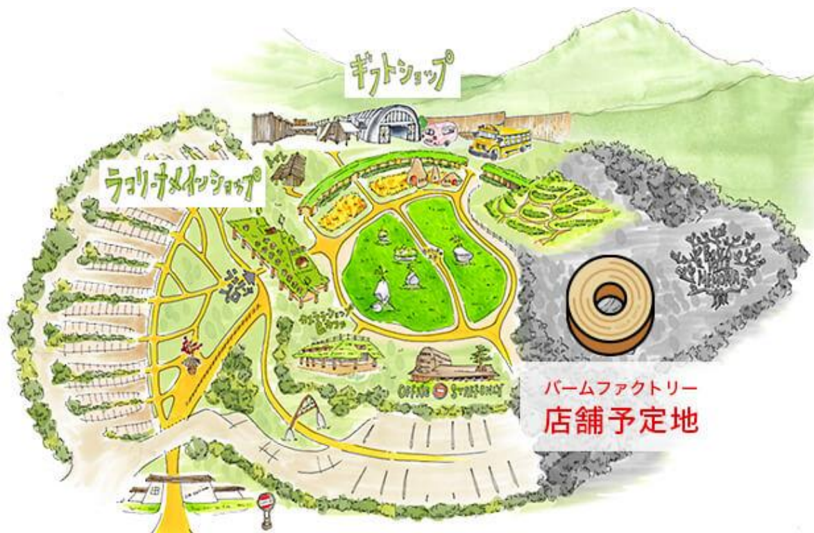
【ラ・コリーナ 見取り図】