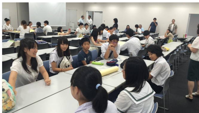
※写真は、昨年度の ネパール支援会議 の様子です